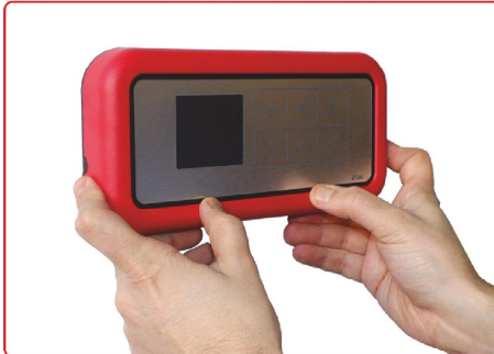
resim 11 / picture 11

Oturmayan kenar için gerekirse çerçeveyi hafifçe esnetiniz. If any problem on edges you may stretch the frame to close smoothly.