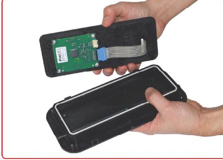
resim 2 / picture 2

Tuş panelinin olduğu bölümü dikkatlice ayırınız. Remove carefully key panel of controller.