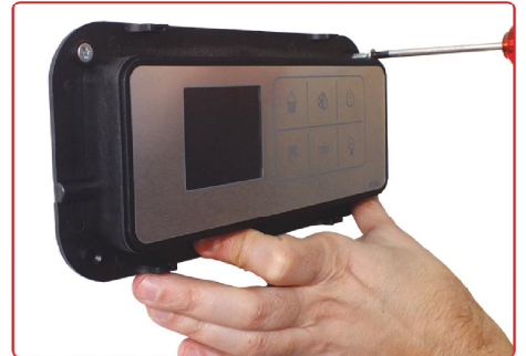
resim 9 / picture 9

Paneli soğutma sisteminizdeki uygun yere monte edin. Mounten the probox to feasible place in your refrigeration plant.