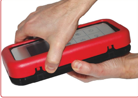
resim 1 / picture 1

Çerçeve yan tırnaklara bastırılarak çıkarılır. Remove the frame by pressing side claws.