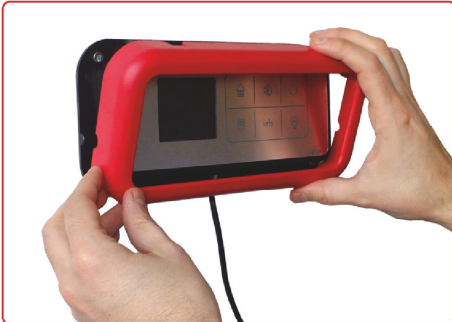
resim 10 / picture 10

Çerçeveyi kapatınız ve dört kenarın düzgün oturduğuna emin olunuz. Close the frame and please check the edges closed smoothly.