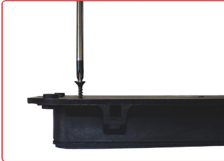
resim 8 / picture 8

6 adet vidayı kullanarak tuş panelini gövdeye bağlayın. By using 6 pcs screw, fasten the keypad to body.