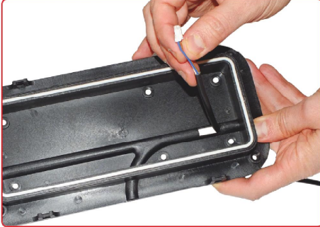
resim 4 / picture 4

FC04 kablosunu gövde deliğinden geçiriniz. Pass through the FC04 cable from hole on body.