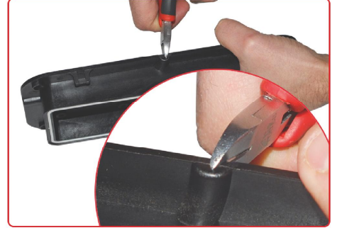
resim 3 / picture 3

Yan bölümde bulunan kablo yuvalarından birini dikkatlice kesiniz. Please cut gently one of the cable slot of controller.