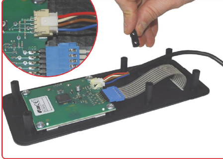
resim 5 / picture 5

FC04 kablosunu konektöre bağlayınız. Connect the FC04 cable to female connector.