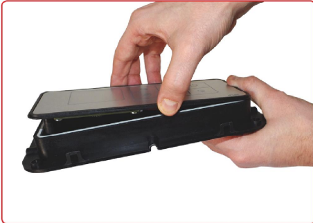
resim 7 / picture 7

Tuş panelini yöne dikkat ederek kapatın. Close the key pad with true direction.